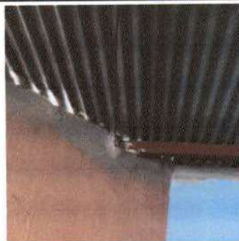
Foto 4: Levantado de 30 centimetro de pared por techo y cambio de lámina