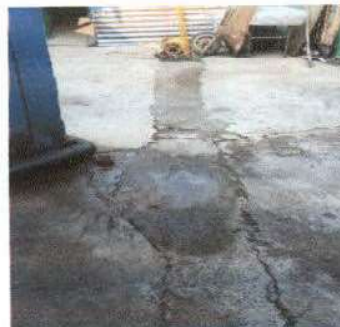
Foto 2: Limpieza y correccion de tubo hacia pozo de absorción y nuevo brocal