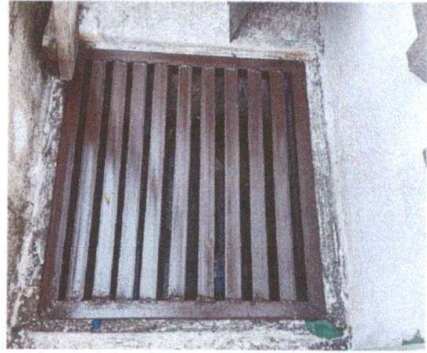
Foto: 2 Cuneta finalizada, con cubierta