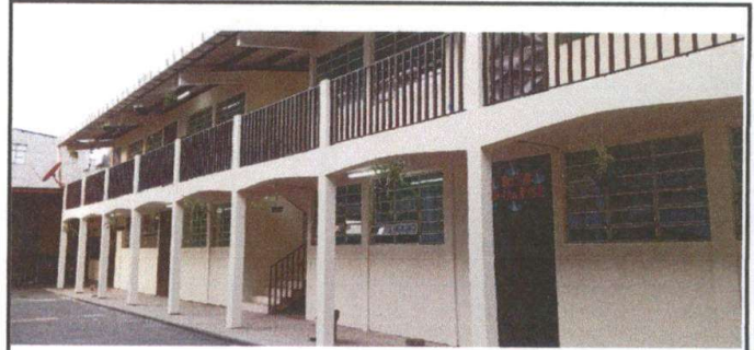
Foto: 6 Edificio pintado

Observación: Si es necesario se pueden agregar hojas adicionales y actualizar el número de hojas.