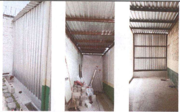
Foto: 4 Techo de bodega finalizado