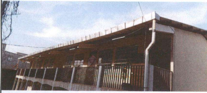
Foto: Canal reparado