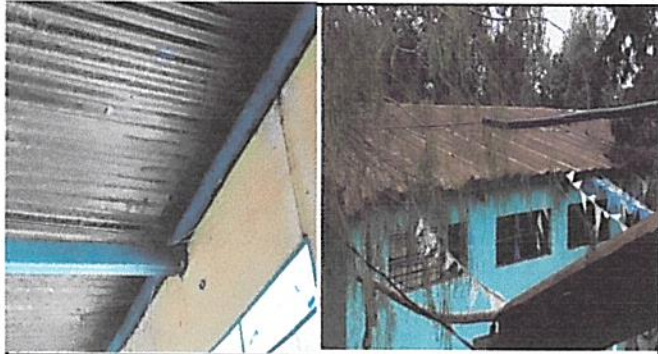
Foto1: Estructura y cubierta de Lamina