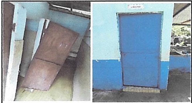
Foto 4: Repocisión de puerta principal y reparación de puerta de baño