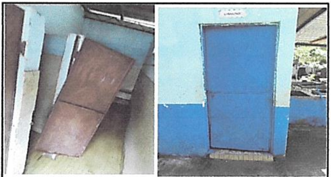
Foto 4: Repocisión de puerta principal y reparación de puerta de baño