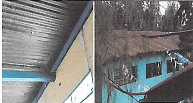
Foto1: Estructura y cubierta de Lamina