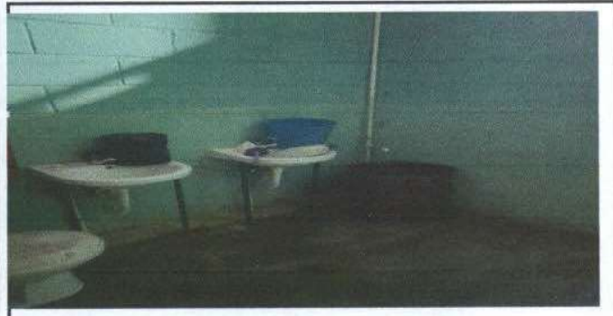
Foto 3: Instalación de 2 baños niñas, pared de división y puerta.