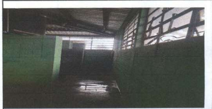
Foto 4: Mejoramiento de baños niños, piso, baños y puertas y migitorio.