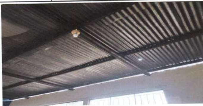
Techo de salón de párvulos