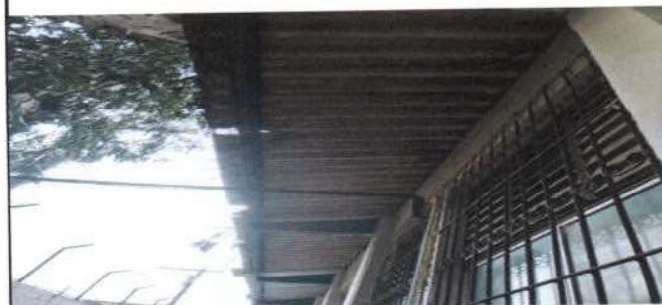
estado de techo módulo 1