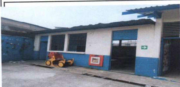
estado de techo párvulos