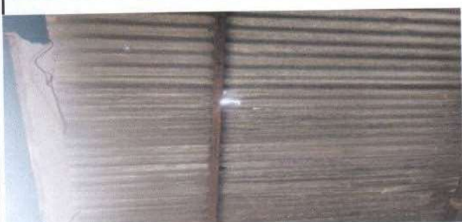
Techo módulo 1