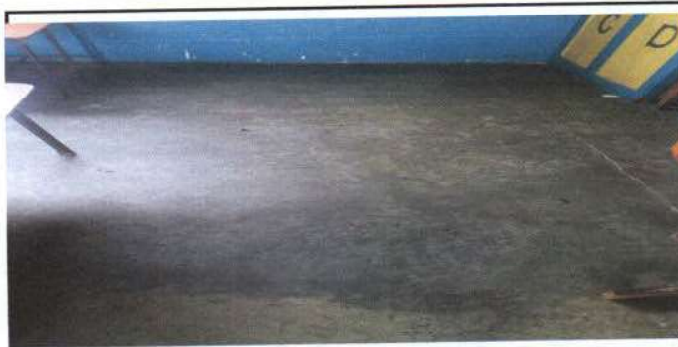
estado del piso salón de párvulos

Observación: Si es necesario se pueden agregar hojas adicionales y actualizar el número de hojas.