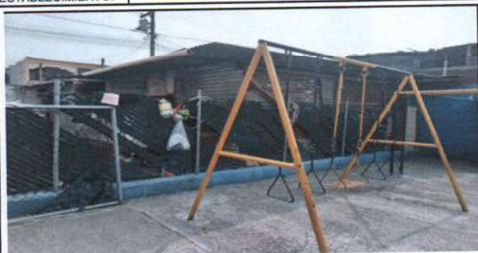
Muro perimetral que divide área de párvulos con guardiana