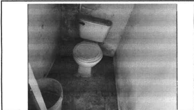
Foto 3: Sanitarios en mal estado es necesario sustituirlos y aplicar pintura en muros