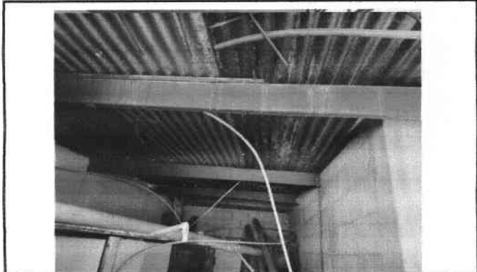
Foto 4: Sistema de agua potable en mal estado es necesario corregirlo