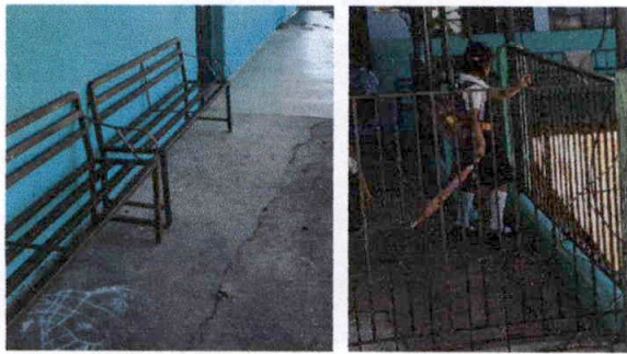
FOTO 7: se pondrá piso cerámico en pasillos y se pintaran las barandas metálicas, mantenimiento incluido.