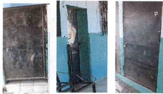
FOTO 8: se remozaran las puertas, reponiendo áreas dañadas y se pintaran.