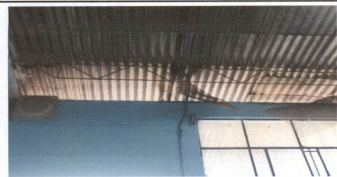
Foto 3: Se necesita colocar costaneras para mejorar la estructura