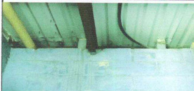
Foto 8: SE NECESITA LA CONSTRUCCIÓN DE UNA BIGA PARA SOSTENER EL TECHO