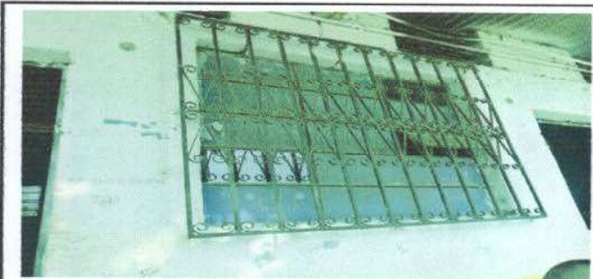
Foto 5: CAMBIO DE VENTANAS ALGUNAS NO SE PUEDEN ABRIR Y SE GENERA MUCHO CALOR