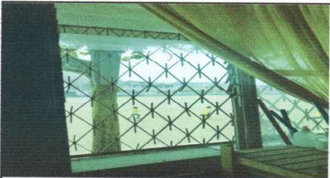
Foto 10. LAS VENTANAS YA NO CUENTAN CON VIDRIOS