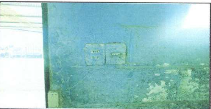
Foto 11. SE ARREGLARA LAS INSTALACIONES ELECTRICAS EN EL ÁREA DE COCINA

Observación: Si es necesario se pueden agregar hojas adicionales y actualizar el número de hojas.