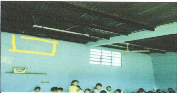
Foto 9. SE ABRIRA ESPACIO PARA QUE ENTRE UN POCO MÁS DE VENTILACIÓN.