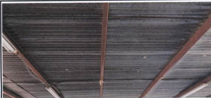
Foto 3: Láminas en aulas del 1 al dos segundo nivel, requiere cambios