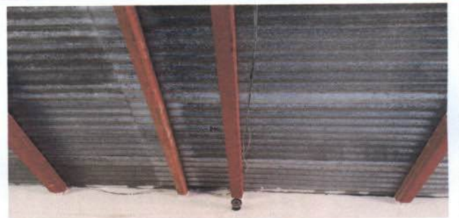
Foto 4: Sustitución de láminas galvanizadas por laminas acanaldas troqueladas aluzinc cal 26