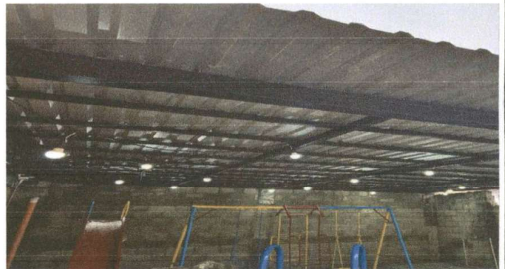
Foto 4: Demolición de paredes en mal estado cambio de lámina en área de juegos infantiles