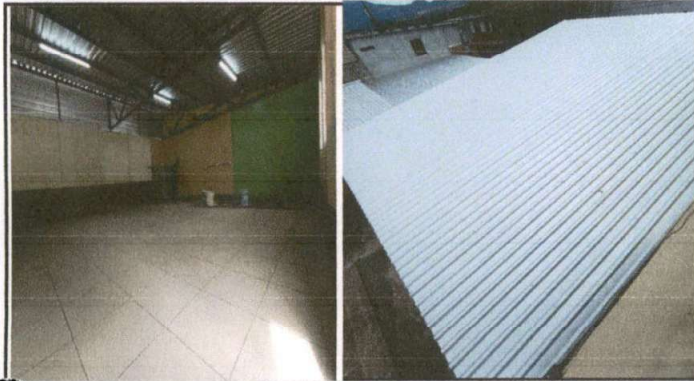
Foto 1: Cambio de techo de cocina con costanera y lámina Maxalum C 26