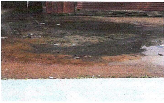
Foto 1: . Parte superior de losa de fosa séptica necesita limpieza