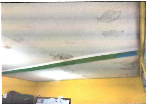
Foto 11: Losa con filtraciones, es necesario impermeabilizar losa