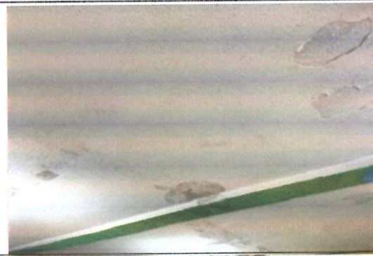
Foto 12: Losa con filtraciones, es necesario impermeabilizar losa