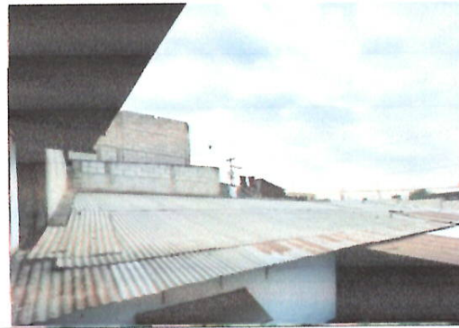
Foto 10: Modulo 1 lamina y sistema electrico en malas condiciones