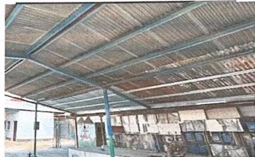
Foto 10: Gimnasio, la estructura necesita mantenimiento y cambio de lamina