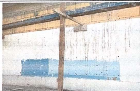
Foto 12: Modulo Cocina, es necesario dejar muebles fijos de concreto con azulejo