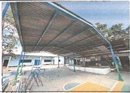
Foto 6: Gimnasio, la estructura necesita mantenimiento y cambio de lamina