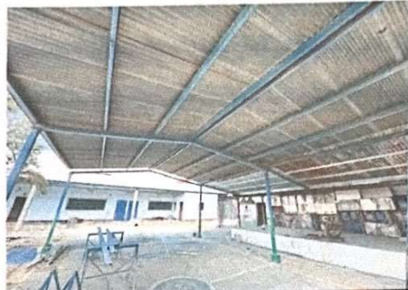
Foto 8: Gimnasio, la estructura necesita mantenimiento y cambio de lamina