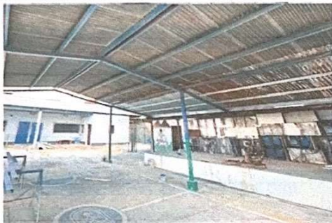
Foto 9: Gimnasio, la estructura necesita mantenimiento y cambio de lamina