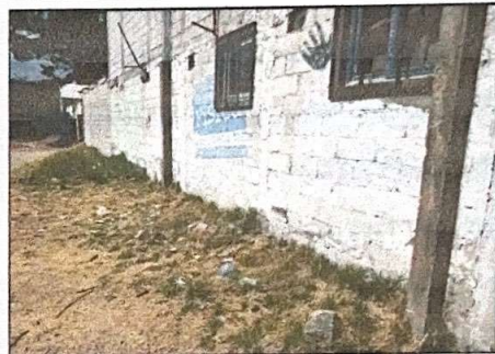
Foto 4: Modulo 1, se observa que necesita repello y cernido, asi mismo el muro se esta desplomando