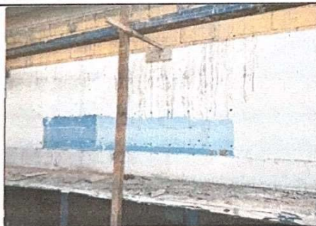
Foto 11: Modulo Cocina, es necesario dejar muebles fijos de concreto con azulejo