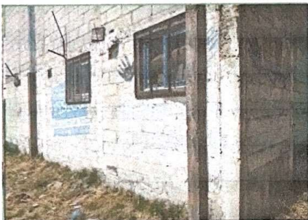
Foto 3: Modulo 1, se observa que necesita repello y cernido, asi mismo el muro se esta desplomando