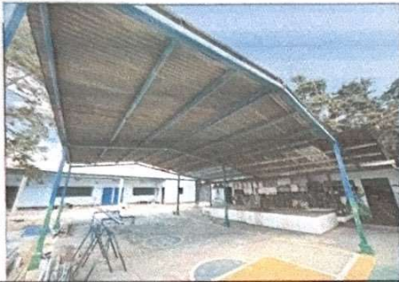
Foto 7: Gimnasio, la estructura necesita mantenimiento y cambio de lamina