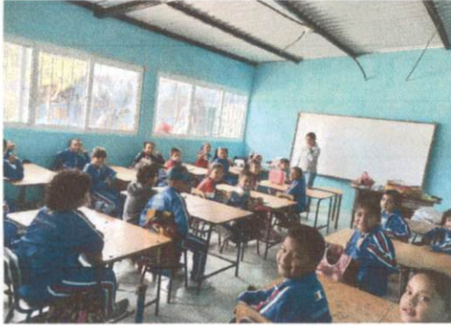
Foto1: SALON DE PRIMERO