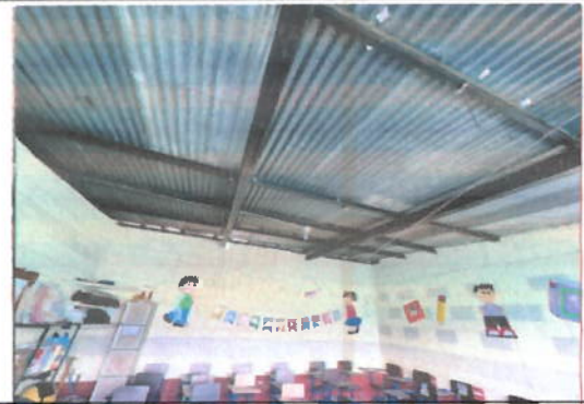
Foto 6: Modulo 1, lamina en mal estado es necesario sustituirla, así mismo darle mantenimiento a la estructura de soporte