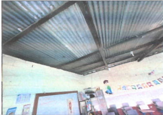
Foto 7: Modulo 1, lamina en mal estado es necesario sustituirla y darle mantenimiento a la estructura de soporte