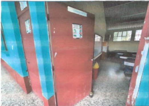
Foto 9: Modulo general, es necesario darle mantenimiento a las puertas