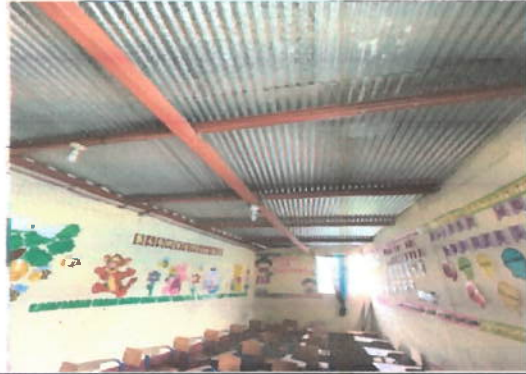
Foto 8: Modulo 1, lamina en mal estado es necesario sustituirla y darle mantenimiento a la estructura de soporte