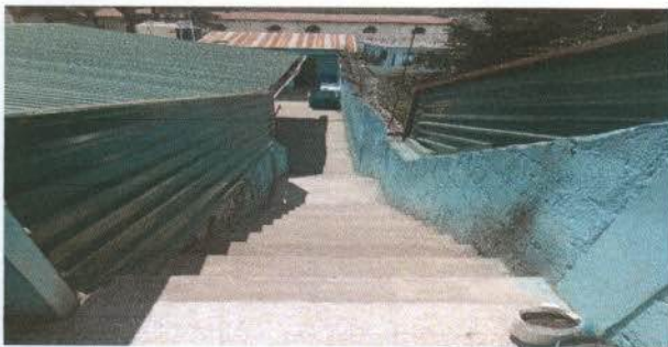
Pasamanos en las gradas