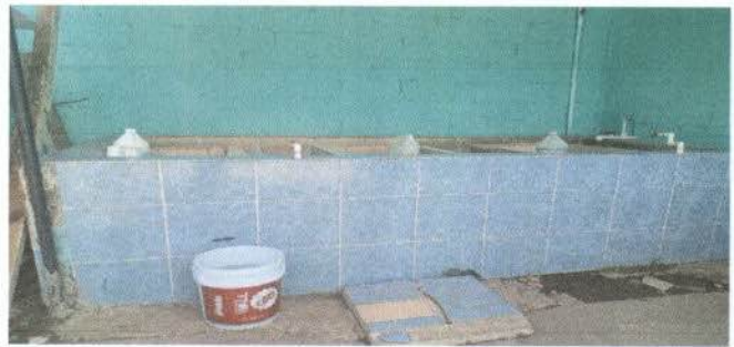
Reparacion de Pila

Observación: Si es necesario se pueden agregar hojas adicionales y actualizar el número de hojas.