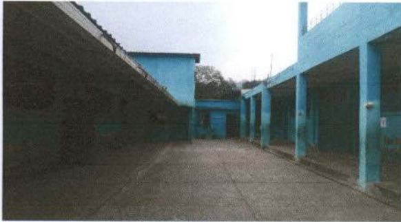
Estructura metalica para el patio