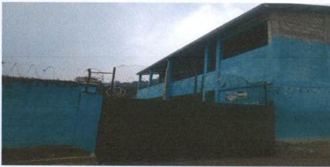
Reforzamiento y pintura de Portón