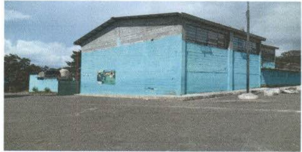
Pintura exterior e interior de la escuela