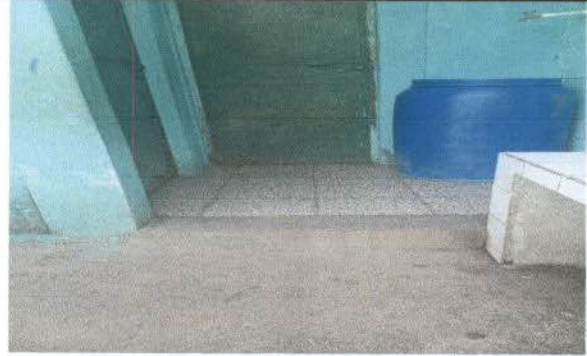
Rampas de acceso