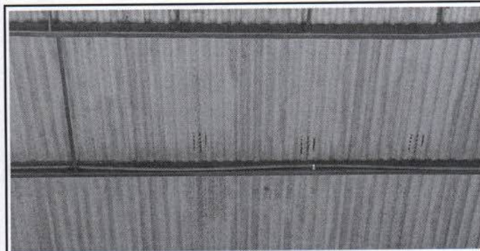
Foto 3: Estructura del segundo nivel, aplicación de pintura anticorrosiva