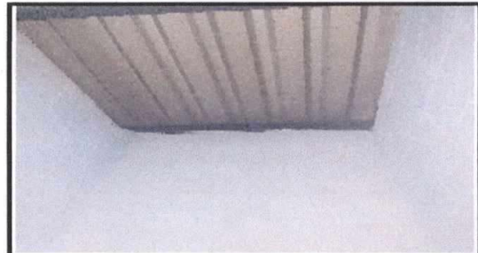
Foto 4: Reparación del sistema eléctrico (sustrucción de lámparas tipo Led y plafoneras en las aulas y corredores, instalación de luz en sanitarios)