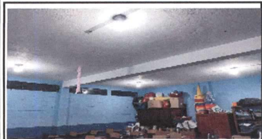
Foto 3: Reparación del sistema eléctrico (sustrucción de lámparas tipo Led y plafoneras en las aulas y corredores, instalación de luz en sanitarios)