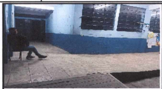
Foto 2: Sustrucción de piso Cerámico en el pasillo del primer nivel del primer módulo