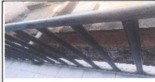
Foto 9: Mantenimiento de barandas de metal del segundo nivel y gradas del primer módulo (lijado y pintura)