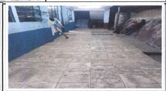
Foto 1: Sustrucción de piso Cerámico en el pasillo del primer nivel del primer módulo