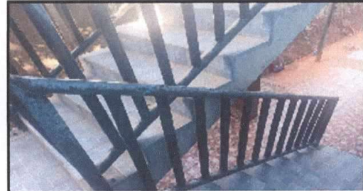
Foto 10: Mantenimiento de barandas de metal del segundo nivel y gradas del primer módulo (lijado y pintura)