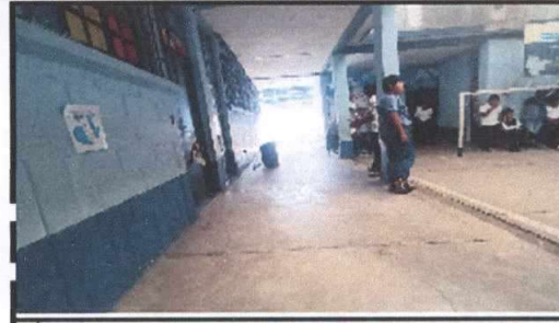
Foto 8: Colocación de piso cerámico en pasillo hacia segundo módulo y corredor del primer nivel de segundo módulo.