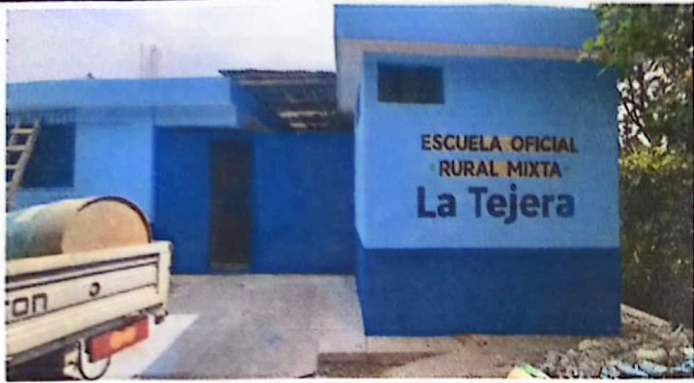
Foto 1: FACHADA PRINCIPAL DE ESCUELA: SE RESANARAN MUROS, Y PINTARAN