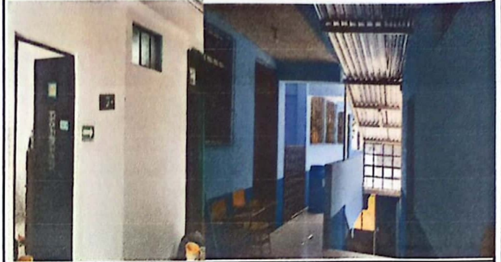
Foto 2: MUROS INTERIORES FISURADOS, ESTOS SE REALIZARAN TRABAJOS DE CERNIDO EN MUROS MAS TALLADO DE LOS MISMOS, ASI MISMO SE PINTARAN.