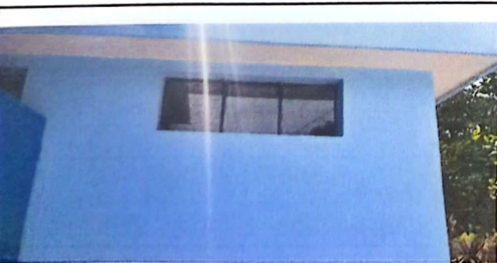
Foto 5: VENTANAS EN MAL ESTADO, LAS CUALES SE SUSTITUIRAN EN SU TOTALIDAD.