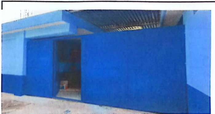
Foto 6: SUMINISTRO E INTALACION DE PORTON + RESANE DE PUERTAS EXISTENTE EN LA ENTRADA DE LA ESCUELA

Observación: Si es necesario se pueden agregar hojas adicionales y actualizar el número de hojas.