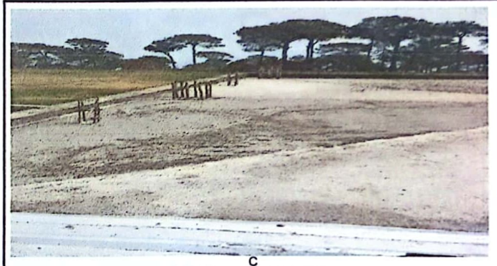
Foto 4: LOSA DAÑADA NO CUENTA CON PAÑUELOS Y CUENTA CON FISURAS, LAS CUALAS OCASIONAN FILTRACIONES DE AGUA, ASI MISMO SE REALIZARAN LOS PAÑUELOS Y SU IMPERMEABILIZACION DE LOSA .