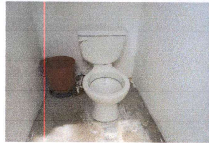
FOTO 8: INSTALACIÓN DE INODOROS EN BAÑOS, FALTA INSTALAR LAS TAPADERAS Y ASIENTOS DE LOS DOS INODOROS.