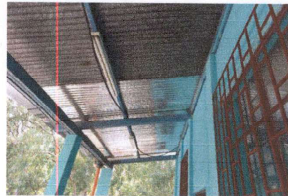
FOTO 2: INSTALACIÓN DE LÁMINA ACANALADA EN SEGUNDO NIVEL Y REPARACIÓN DEL SISTEMA ELÉCTRICO