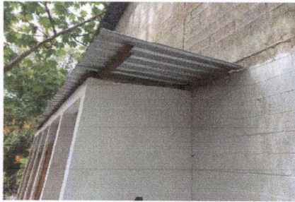
FOTO 1: INSTALACIÓN DE ESTRUCTURA DE METAL Y LÁMINA TROQUELADA EN BAÑOS