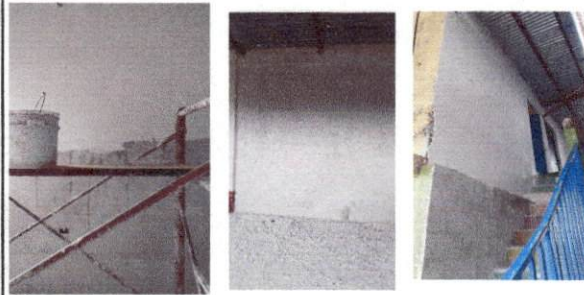
Foto 4: Reparación de repello y cernido de paredes, pintura de muros exterior e interior