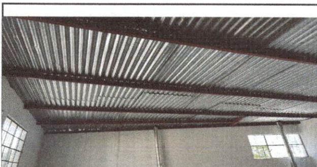
Foto 6: CUBIERTA DE LAMINA DE COCINA EN MAL ESTADO, ENTRA EL AGUA Y MOJA LA PARED.

Observación: Si es necesario se pueden agregar hojas adicionales y actualizar el número de hojas.