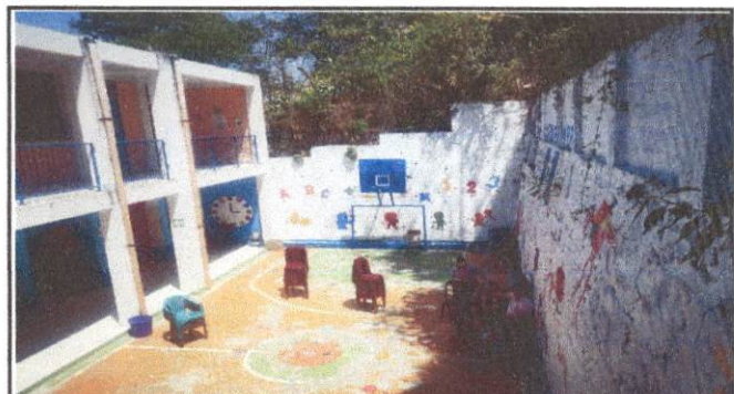
Foto 4: El clima (lluvia) es uno de los factores que mas ha afectado a los niños en sus actividades diarias porque se filtra el agua en la pared.