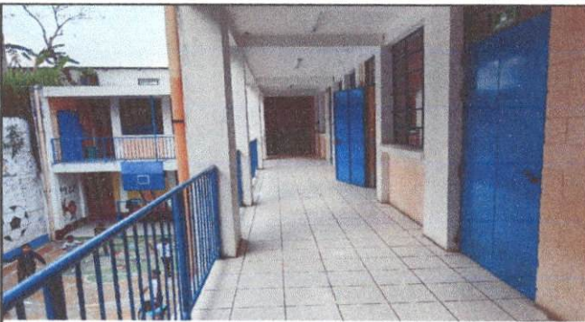
Foto 3: En muchas ocasiones se han tenido que cancelar solicitudes para elaborar un mejor mural ya que la construcción no es la adecuada para realizarla.