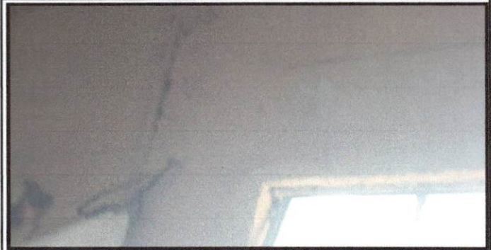
Foto 2: Sernido de paredes del aula de computacion y aulas de preparatoria