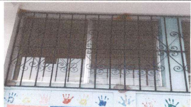
Foto 6: Terminado de trabajos en la colocación de balcones de metal, parte de atrás

Observación: Si es necesario se pueden agregar hojas adicionales y actualizar el número de hojas.