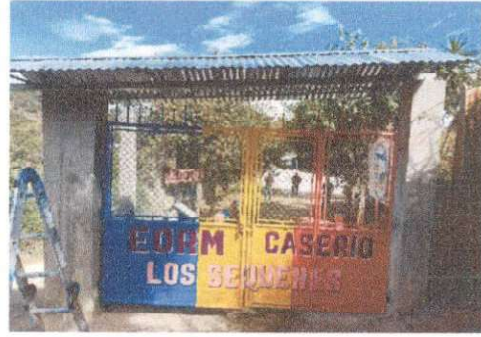
Foto 2: Trabajos en la colocación de Techo de dos aguas a portón principal terminado