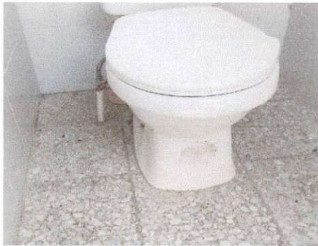
Foto 5: Trabajo de reparación de tubería de agua potable para sanitario terminado