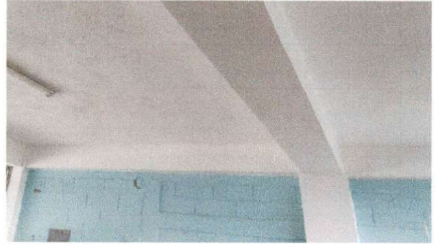
Foto 2: Lado interno pintado y terminado salón 1 de losa después de remosar