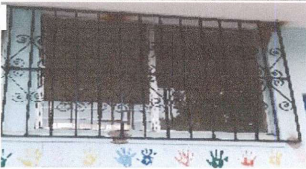
Foto 5: Terminado de trabajos en la colocación de balcones de metal, parte de frente