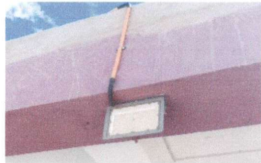
Foto 6: Colocación de portafocos doble y colocación de cable eléctrico hacia portón terminado

Observación: Si es necesario se pueden agregar hojas adicionales y actualizar el número de hojas.