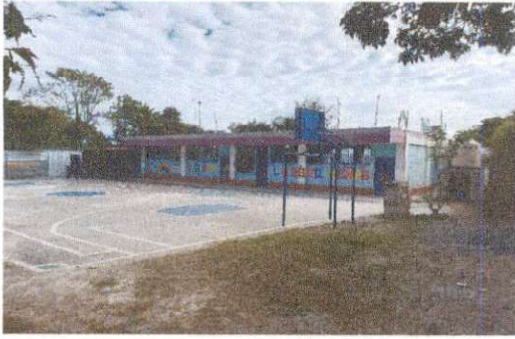
Foto 1: Ingreso a la EODP ANEXA A EORM, Caserío Los Sequenes con los trabajos ya terminados