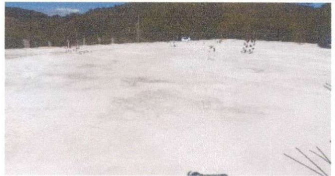
Foto 4: Terminado de resanado e impermeabilización de pañuelos de losa existente