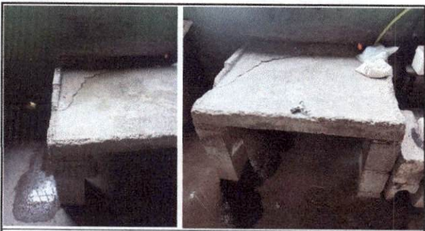
Foto 5: se requiere el cambio de mesa de concreto ya que se encuentra en mal estado, y no está apto para el lavado de trastos y verduras.