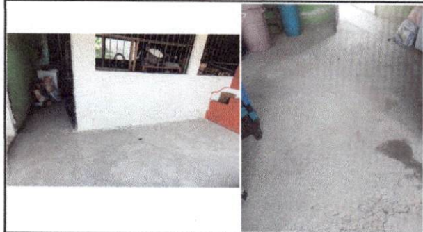
Foto 4: La cocina carece de piso. Por lo que necesita mejorar el suelo para que los alimentos sean preparados higiénicamente.