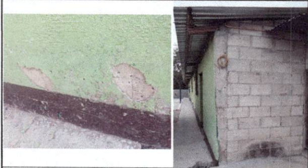
Foto 1: Frente INEB de Telesecundaria, necesita remover y repellar nuevamente, debido a que ya se está levantando el repello que tiene. Después del repello se necesita pintar.