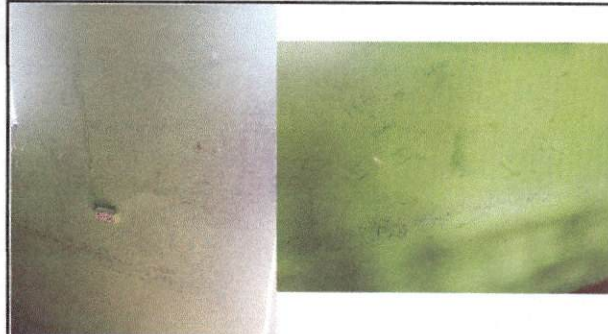
Foto 2: pintura de las aulas ya se encuentra deterioradas, por lo que necesita nueva pintura.