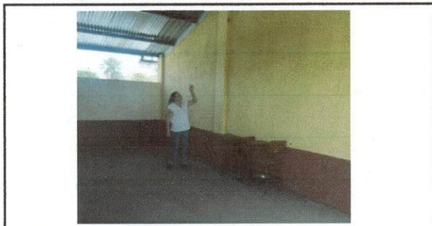
Foto 6: Area que se utiliza el remosamiento para la modificacion de la direccion.