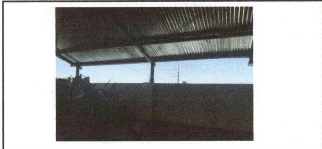
Foto 3: Lugar donde se modificara para que se utiliza como area de cocina.