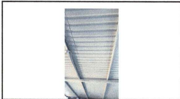
Foto 3: Salón de clases donde se necesita colocar cielo falso, porque el calor es insoportable y los estudiantes no lo soportan.