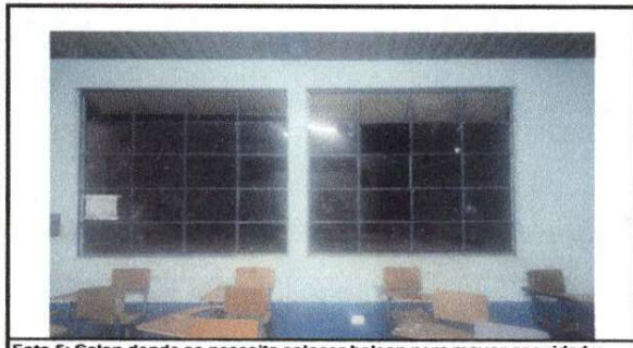
Foto 5: Salon donde se necesita colocar balcon para mayor seguridad y ventilacion ya que el calor es insportable cuando los alumnos reciben clases.