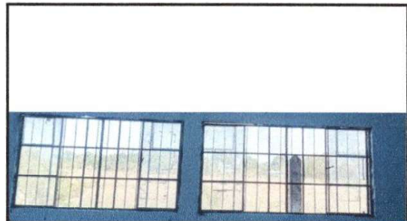
Foto 4: Se necesita colocar balcones para tener una mayor seguridad porque los vidrios son muy frágiles.