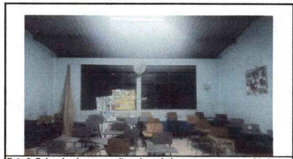
Foto 6: Salon donde se necesita colocar balcon para mayor seguridad y ventilacion ya que el calor es insportable cuando los alumnos reciben clases.

Observación: Si es necesario se pueden agregar hojas adicionales y actualizar el número de hojas.