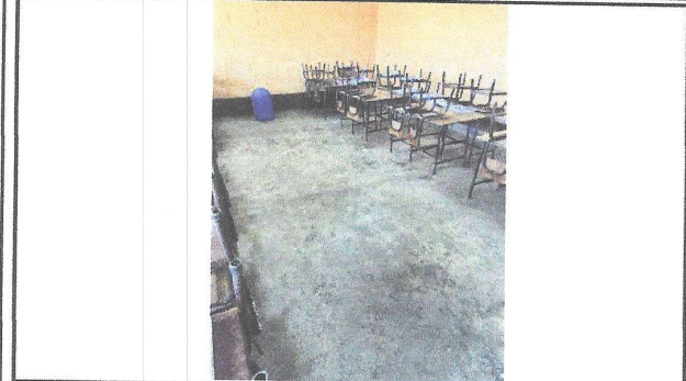
Foto 1: En el Boque B, no se cuenta con piso en los salones por lo que se propone la colocación del mismo.