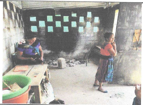
Foto 10: Se deberá realizar la construcción de una estufa de leña con su respectiva chimenea.