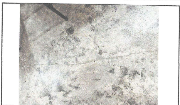
Foto 4: Se aprecian las grietas en el concreto, debido a que no se realizaron los corte al concreto.