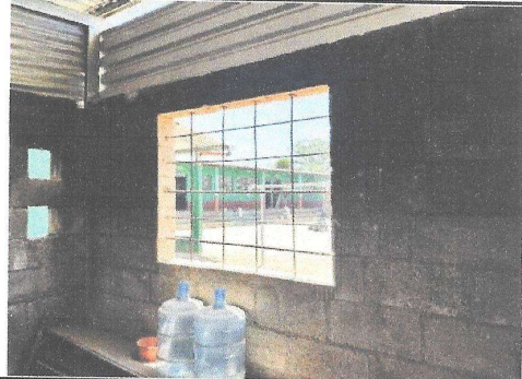
Foto 8: No se cuenta con ventanas en el área de cocina, únicamente cuenta con varillas para la protección del espacio.