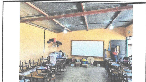
Foto 2: El alisado de concreto en el piso, presenta fisuras debido a que no se realizaron las juntas de dilatación al momento de la aplicación en el bloque B.