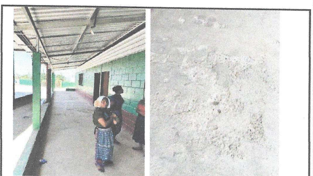
Foto 6: Se puede apreciar el desgaste que ha sufrido el piso de concreto debido al paso de los años.