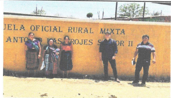
Foto 12: Fotografía con director y OPF, al terminar la visita de campo.