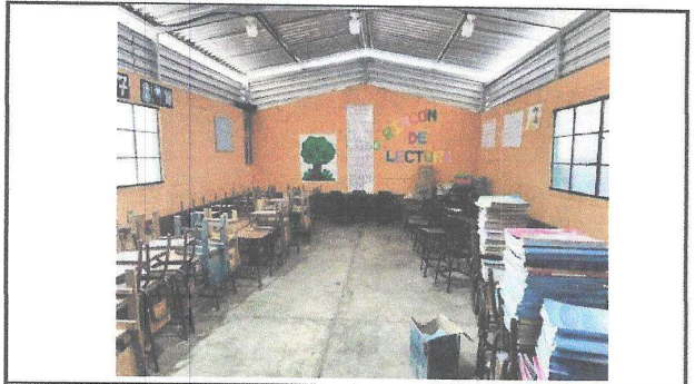
Foto 5: En el Bloque C si se realizaron las juntas de dilatación, pero no se cuenta con piso en los salones de clases.