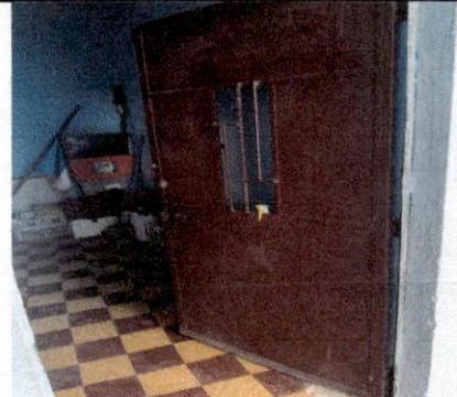
FOTO 5: Instalación de piso cerámico en varias áreas internas, bodega, aula y vestíbulo

Observación: Si es necesario se pueden agregar hojas adicionales y actualizar el número de hojas.