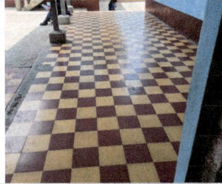
FOTO 2: instalacion de piso cerámico en corredores área de ingreso