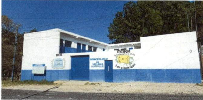
Foto1: Frente y entrada de la EORM Caserío Los Encuentros