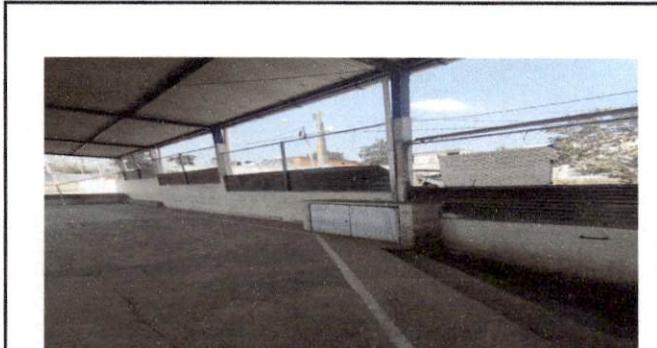
Foto 9: modificar y reparar el muro con mas hiladas de block , ya que la lamina es insegura y hemos tenido robos en el establecimiento.