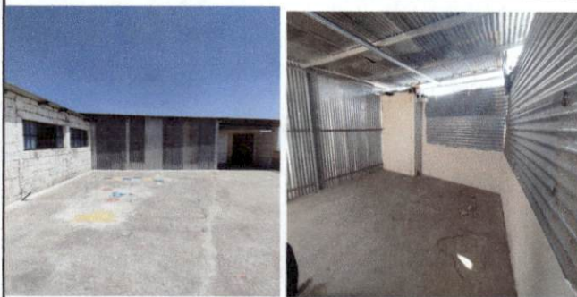
Foto 3: reparacion del muro de las paredes de este salon de clases ,