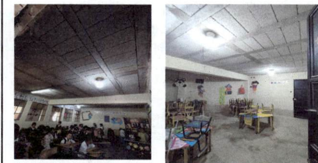
Foto 5: repello y cernido en el cielo y pared de 2 salones y piso