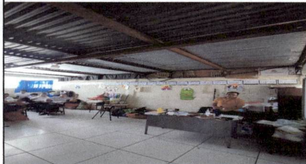
Foto 4: reparacion del muro de paredes de 3 salones de clases se encuentran muy bajitos y los espacios entre los mismos estan separados con cartonones, se necesitan mas ventanas la ventilacion es pobre y hace