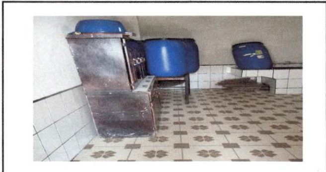
Foto 10: se necesita una mesa de concreto y azulejo en la cocina, ya que no contamos con mobiliario