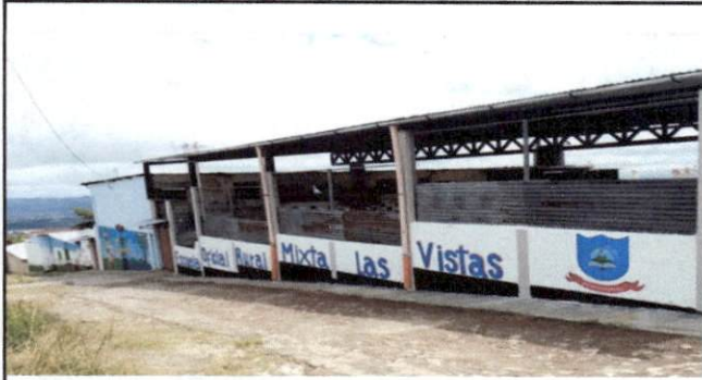
Foto1: Frente y entrada de la EODP ANEXA A EORM, necesita reparacion de muro perimetral, con unas laminas está protegido