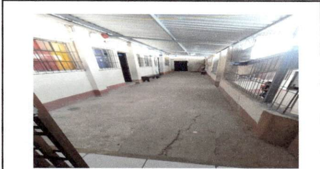
Foto7: sustitucion de piso, el corredor se encuentra con muchos grumos y niños y docentes han tenido caídas con consecuencias