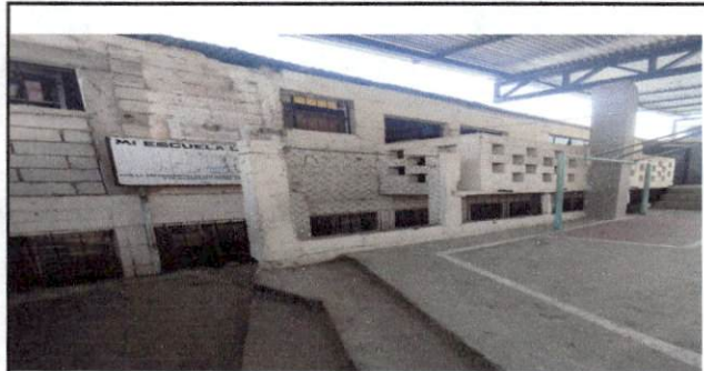
Foto 2: repello y pintura de los salones parte alta y baja, se encuentra en malas condiciones la pared