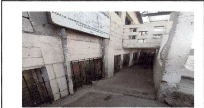
Foto 8: colocar piso en rampa de ingreso de alumnos, repello y cernido a paredes