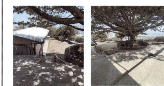
Foto 6: el area de sanitarios se encuentra en una parte baja, la baranda se destrulló y hemos tenido accidentes de niños que han caido o rodado por la baranda en mal estado.

Observación: Si es necesario se pueden agregar hojas adicionales y actualizar el número de hojas.