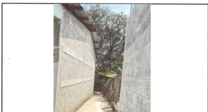
Foto 6: Ampliación de muro perimetral del área frontal de la escuela.

Observación: Si es necesario se pueden agregar fotografías adicionales. Se indica el número de hojas.