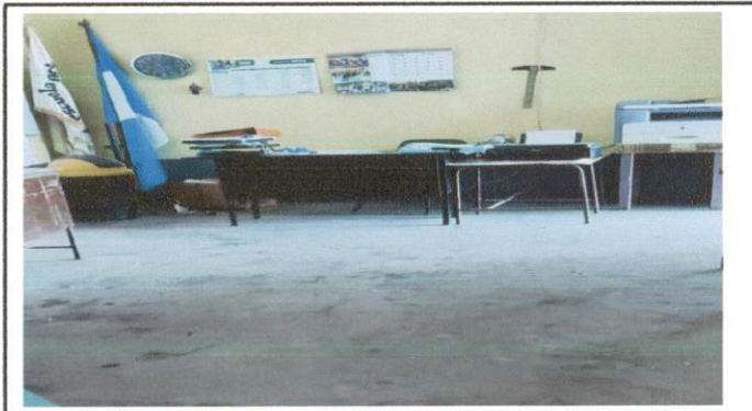
Foto 4: El piso de la Dirección de la escuela no es el adecuado, ya que se encuentra rajado por el paso de los años por lo que se le colocará piso de cerámica.