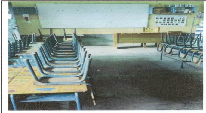
Foto 2: El piso del aula del grado de Preprimaria no es el adecuado, ya que se encuentra rajado por el paso de los años por lo que se le colocará piso de cerámica.