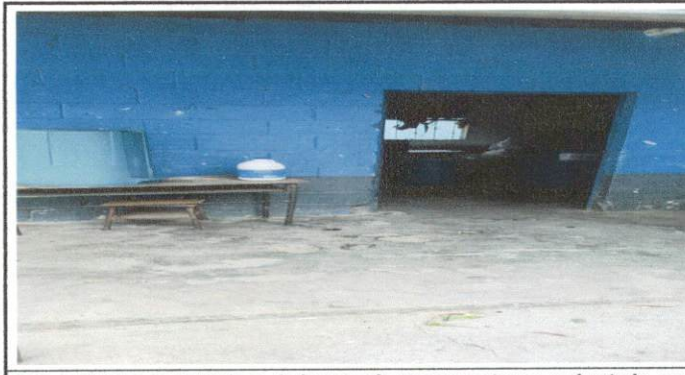
Foto 6: El piso de la bodega de la escuela se encuentra en mal estado, por lo que se le colocará piso de cerámica.

Observación: Si es necesario se pueden agregar hojas adicionales y actualizar el número de hojas.