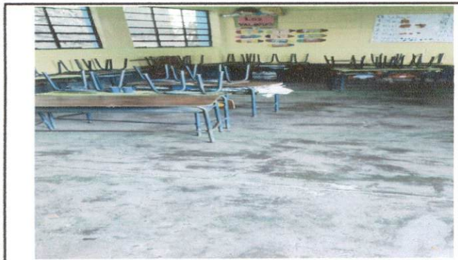
Foto 3: El piso del aula de Segundo Primaria no es el adecuado, ya que se encuentra rajado por el paso de los años por lo que se le colocará piso de cerámica.