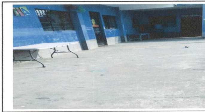
Foto 5: El piso del corredor de la escuela esta rajado, y en mal estado por lo que se le colocará piso de cerámica.