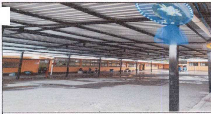
BAJADA DE AGUA PLUVIAL CONECTAR CON OTRO TUBO PARA QUE QUEDE SUBTERRANEO Y EVITAR HUMEDAD EN EL AREA RECREATIVA