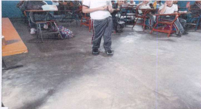
SUSTITUCIÓN DE PISO DE CEMENTO POR PISO CERAMICO. EN SALON DE LASES