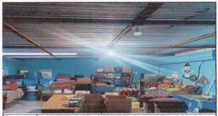
REPARACIÓN DE ESTRUCTURA PORTANTE (PINTURA EN LA COCINA )

Observación: Si es necesario se pueden agregar hojas adicionales y actualizar el número de hojas.