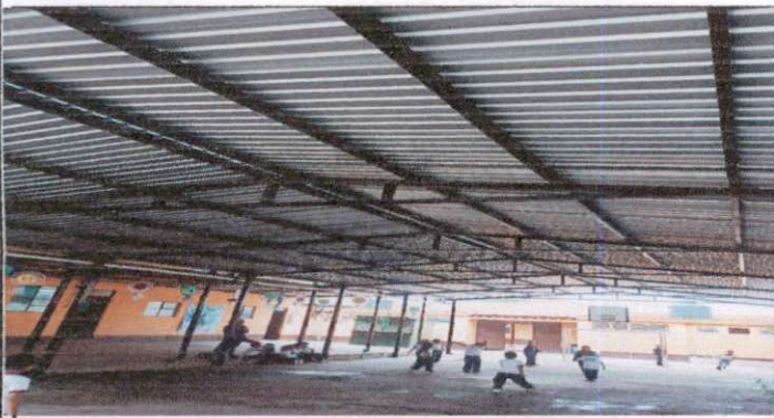
COLOCAR ENERGIA ELECTRICA (ILUMINACIÓN ) EN EL ESPACIO DEL AREA RECREATIVA, YA QUE ESTA MUY OBSCURO PARA REALIZAR ACTIVIDADES DE APRENDIZAJE.