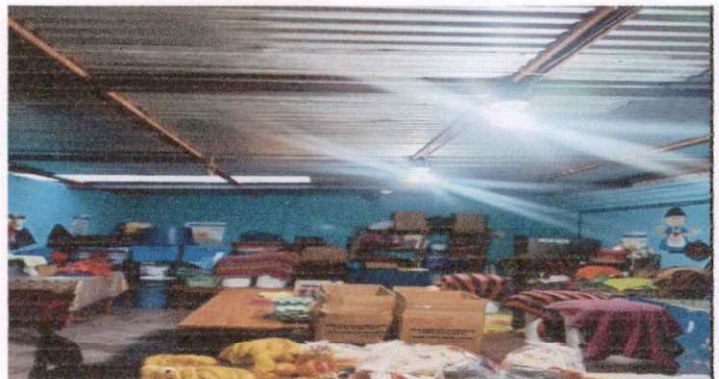
SUSTITUCIÓN DE LAMINA EN COCINA.