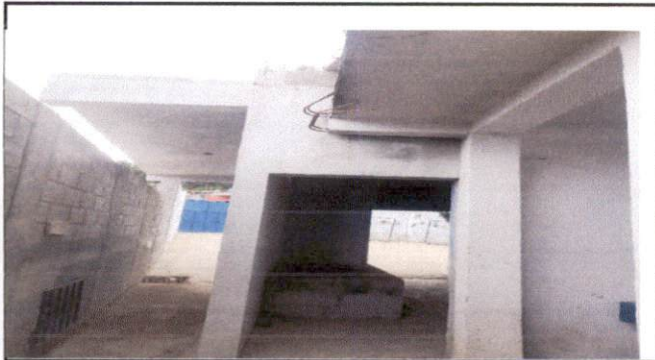
Foto 3: Techado de la cocina, creando un espacio adecuado y pertinente en la cocina escolar.