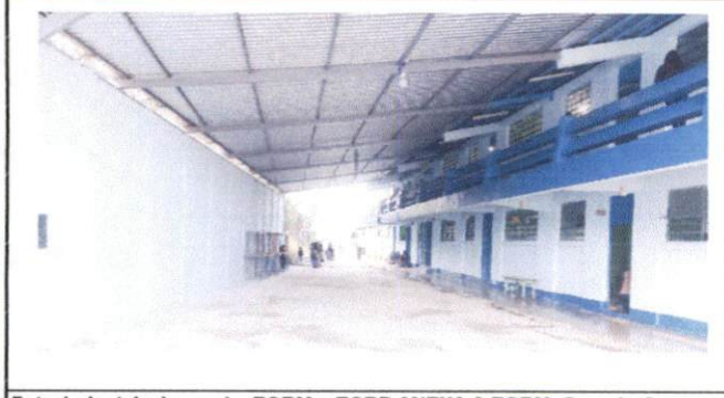
Foto 1: Instalaciones de EORM y EODP ANEXA A EORM, Caserío Cruz Verde, Jornada matutina.