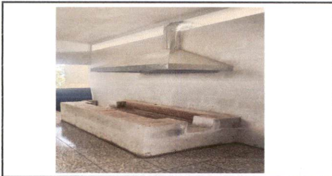
Foto 5: Estufa de leña, funcional para la preparación de la alimentación escolar de los estudiantes del nivel primario y del nivel preprimario.