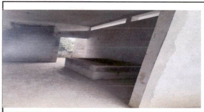
Foto 4: Se observa el cambio de piso, evidenciando las condiciones adecuadas y seguras en la cocina escolar.