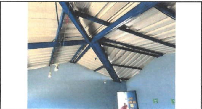
Foto 5: La instalación eléctrica de luz, se encuentra con problemas debido a que no se ha instalado de manera apropiada.