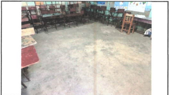
Foto 4: Se cuenta únicamente con piso de torta de cemento, por lo que se propone colocar piso de granito.