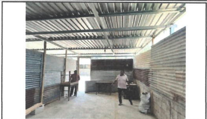
Foto 2: El salón de clases al ser de lámina genera mucho calor para los alumnos.