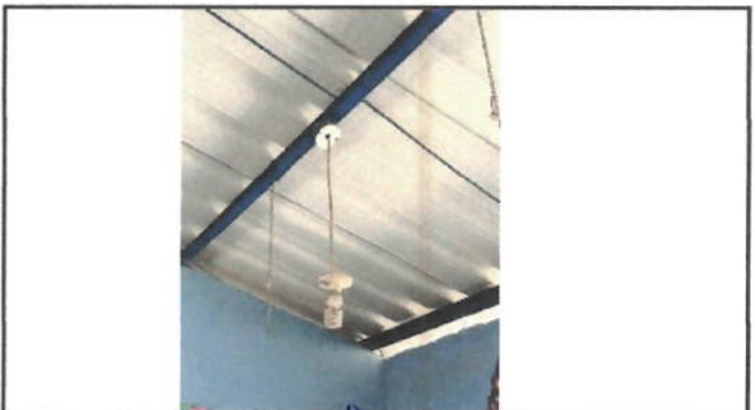
Foto 6: Se ha utilizado cable paralelo para realizar la instalación eléctrica.