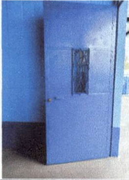
Foto1: Pintura en puertas.