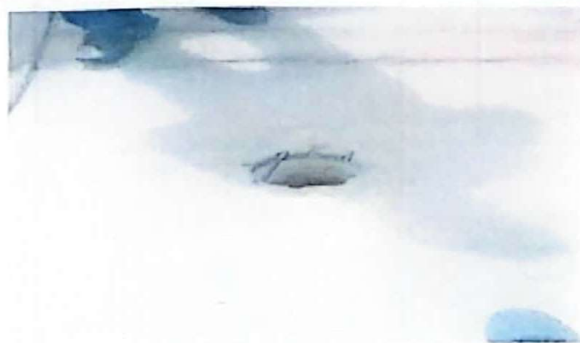
Foto 11: Colocacion de 2 reposadero en el patio de la escuela ya que es un peligro para los estudiante.