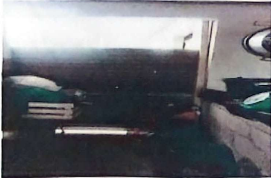
Foto 7: Sustrucion de lamina en la puerta de la cocina por una puerta formal.