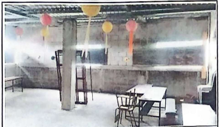
Foto 2 Imagen donde se necesita sustitucion de lamina en las ventanas