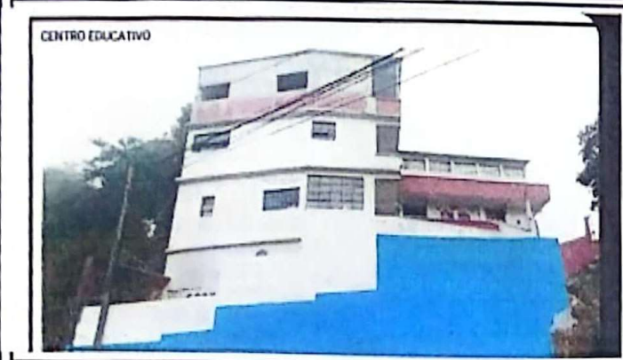
Foto 1 Imagen de la entrada de la EORM EL REFUGIO