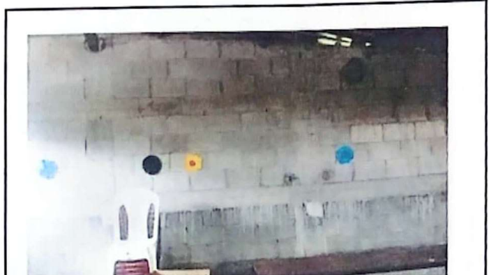
Foto 4: Repello completo de las paredes del salon interior y exterior