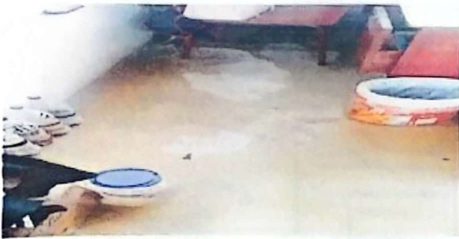
Foto 9: Sustrucion de piso en dos aulas por piso ceramica por el deterioro.