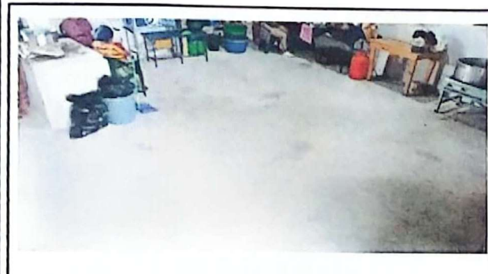
Foto 3: La cocina necesita sustituir el piso rustico por piso ceramico