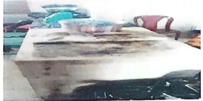
Foto 8: Terminacion de una mesa de concreto en la cocina para picar verduras