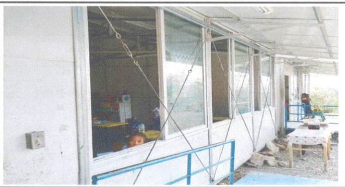
Foto 5. Complemento de Balcon en Ventanas Corredizas