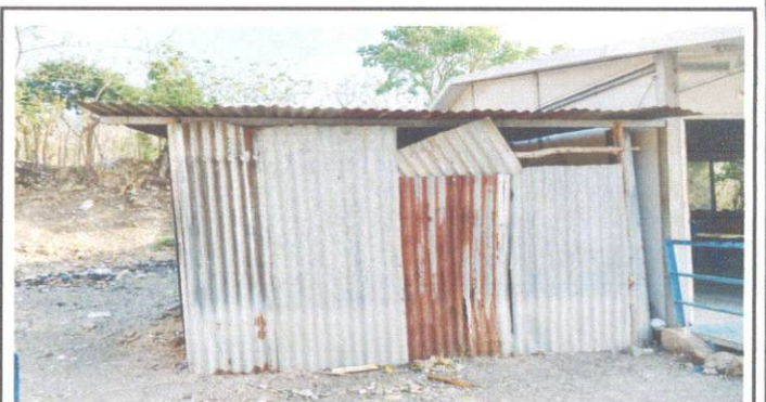
Foto 4. Sustitución de Techo de Bodega