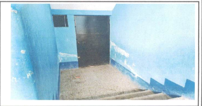
Foto 6. Aplicación de Pintura en aulas interior y exterior

Observación: Si es necesario se pueden agregar hojas adicionales y actualizar el número de hojas.