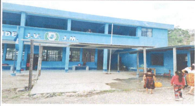
Foto 1. Modulo 1 Sustitución de Techo de Corredor.