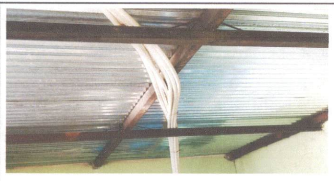
Foto 3. de Techo de Cocina