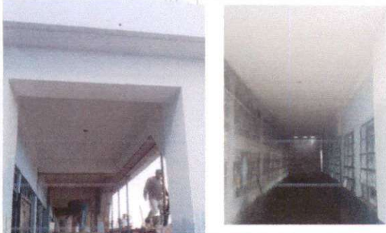
Foto 5: tallada de corredores, al unir la loza con el muro se formo un pasillo que sera de mucha utilidad con los estudiantes