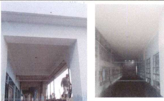
Foto 5: tallada de corredores, al unir la losa con el muro se formó un pasillo que será de mucha utilidad con los estudiantes