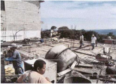
Foto 1: Inicio el fundidor con sus trabajadores a fundir toda la losa