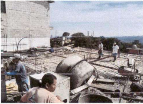
Foto1: Inicio el fundidor con sus trabajadores a fundir toda la loza