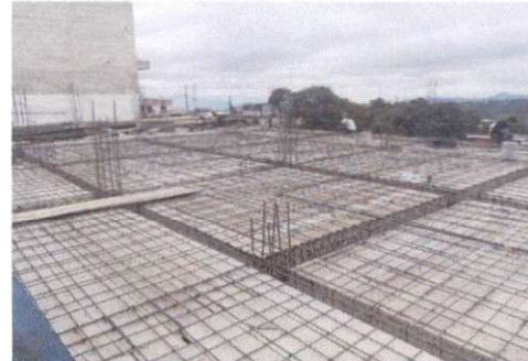
Foto 6: Se reforzó toda la emparrillada, preparando todo para la loza.

Observación: Si es necesario se pueden agregar hojas adicionales y actualizar el número de hojas.