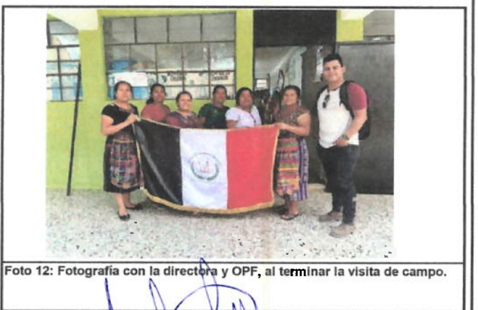
Foto 12: Fotografía con la directora y OPF, al terminar la visita de campo.