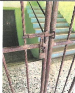
Foto 6: La puerta tipo rejilla que divide el primer y segundo nivel, se encuentra en malas condiciones por lo que deberá ser reemplazada.