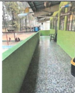
Foto 4: Se necesita colocar un pasamanos metálico para elevar la altura y evitar que los niños sufran accidentes.