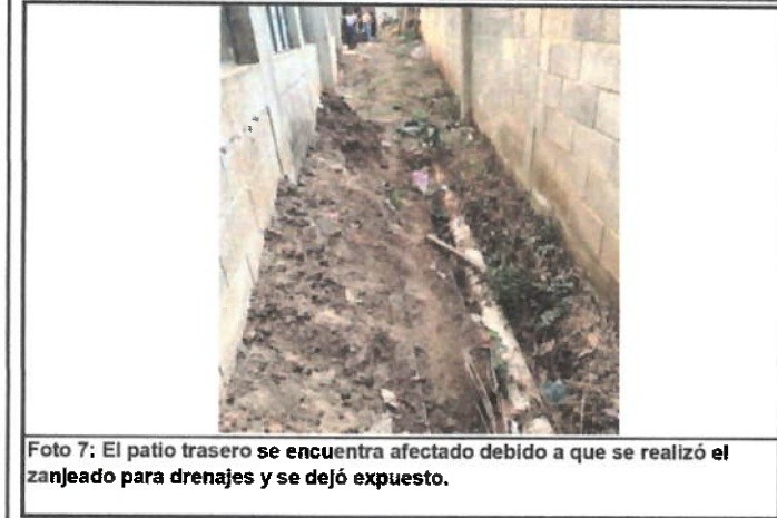
Foto 7: El patio trasero se encuentra afectado debido a que se realizó el zanjeado para drenajes y se dejó expuesto.