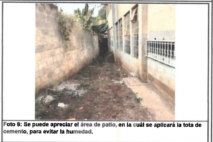
Foto 8: Se puede apreciar el área de patio, en la cuál se aplicará la tofa de cemento, para evitar la humedad.