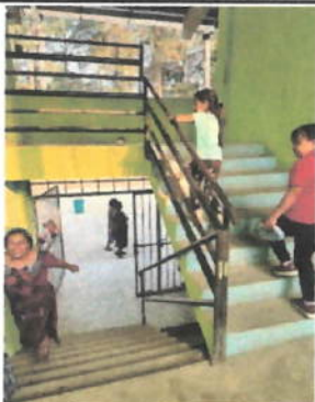
Foto 5: Tomando en cuenta la corrosión y las piezas faltantes a la barandilla, se propone el cambio de la misma.