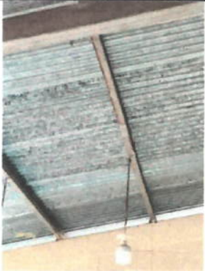
Foto 1: Actualmente la instalación eléctrica se ha realizado con cable paralelo el cuál no es indicado para dicho proceso.