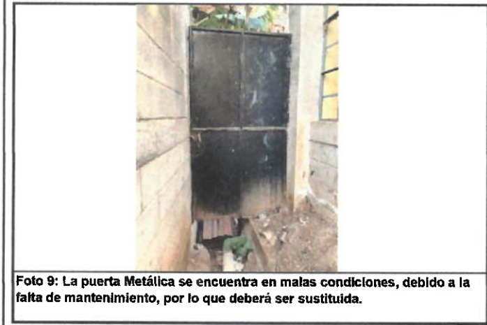
Foto 9: La puerta Metálica se encuentra en malas condiciones, debido a la falta de mantenimiento, por lo que deberá ser sustituida.