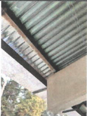
Foto 3: Se deberá realizar el mantenimiento a al canal pluvial, limpieza y rectificación de niveles.