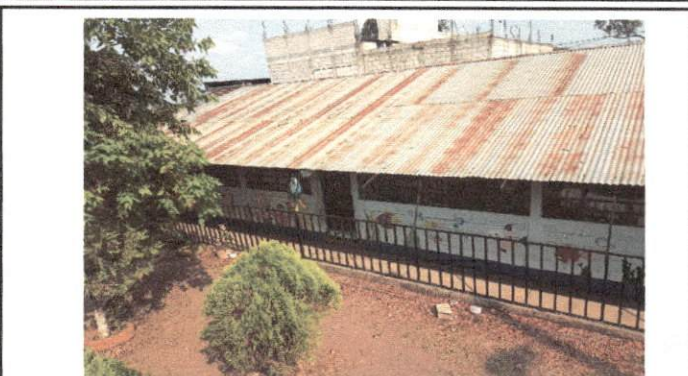
Foto 2: desmontado e instalación de lámina y estructura nueva de 3 aulas del módulo de preprimaria