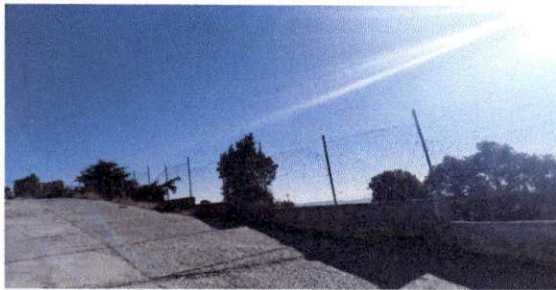
Foto 3: Vista de parte del cerco perimetral de la parte superior de la escuela que comprende 60 metros de largo. Lugar donde se solicita un muro de dos metros de alto para brindar un mejor resguardo a la