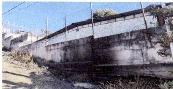
Foto 5: Se observa la parte del cerco perimetral inferior de la escuela que colinda con el callejón, de una extensión de 15 metros, de los cuales 8 se encuentran en riesgo de hundimiento debido al socavamiento.