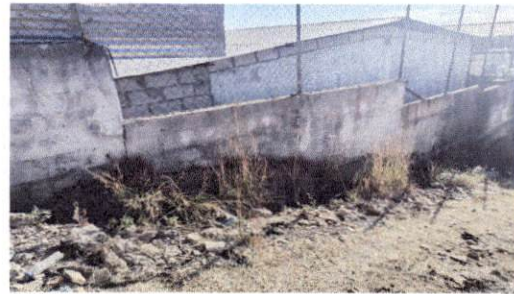
Foto 4: Parte inferior del cerco perimetral de la escuela, que colinda con el callejón: calle de terracería que se socava cada invierno debido a las corrientes de agua y sedimentos que arrastra.