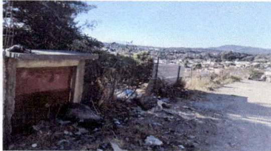
Foto 1: Parte superior de la escuela Margaritas; se aprecia el cerco perimetral con cemento de block y estructura metálica con malla, con una extensión de 60 metros de largo.