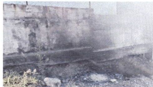
Foto 6: Vista de los 8 metros que están en riesgo de socavamiento, del muro perimetral de la parte inferior de la escuela.

Observación: Si es necesario se pueden agregar hojas adicionales y actualizar el número de hojas.