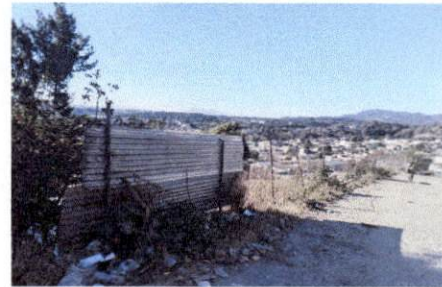
Foto 2: Cerco perimetral del establecimiento. Se aprecia la carretera que colinda con la escuela. Al mismo tiempo, la vulnerabilidad que representa el cerco de malla y lámina ante situaciones de delincuencia o acoso a la población