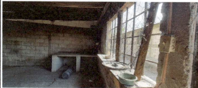
Foto 5: Derivado a las malas condiciones del cuarto de cocina, se dejo de usar, debido a grietas grandes que se han sido ido expandiendo, provocado por la fosa que se encuentra debajo de la misma.