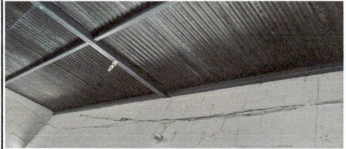
Foto 2: Derivado a la oxidación y filtración de agua en aberturas del techo, es necesario el cambio de todas la láminas e instalar láminas troqueladas calibre 26, como también aplicar nueva pintura a la estructura.