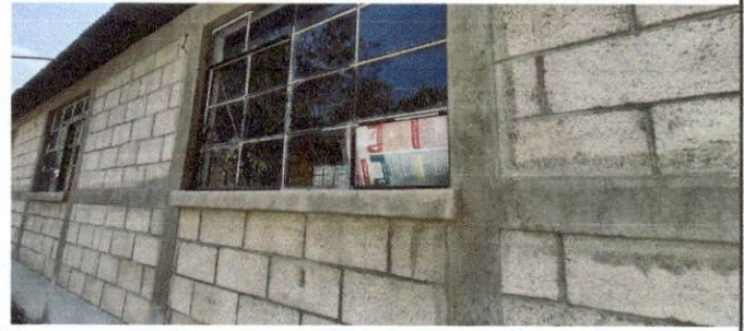
Foto 6: Todas la ventanas no cuentan con los vidrios en buenas condiciones, por la cual es necesario, desmontarlos, limpiarlos, agregarles silicón y comprar vidrios nuevos para las faltantes.

Observación: Si es necesario se pueden agregar hojas adicionales y actualizar el número de hojas.