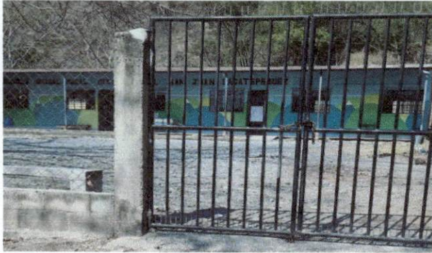
Foto1: Frente y entrada de la EORM Patanil