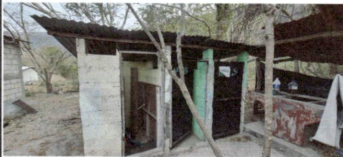
Foto 3: Los niños no cuentan con sanitarios en buenas condiciones, tanto en cantidad, como buen espacio y con una estructura en malas condiciones la cuales se deben remozar.