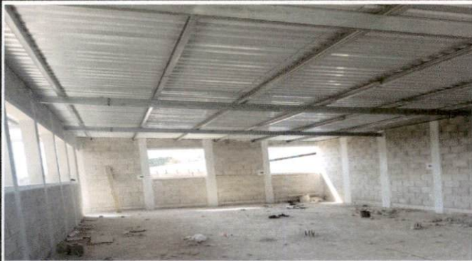
Foto 3: Instalación de energía eléctrica dentro de los salones y pintada al final de todo los trabajos adentro y afuera.