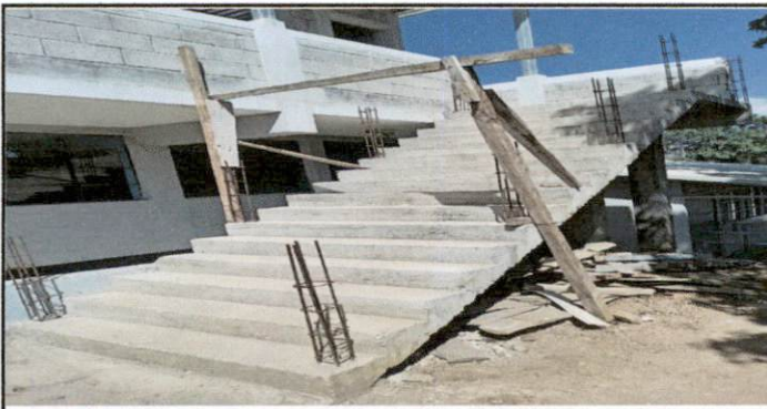
Foto 5: Seguimiento de pasamano de concreto en las gradas para el segundo nivel.