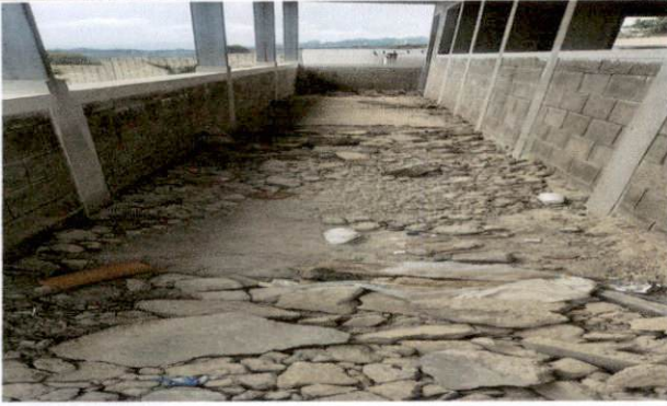
Foto 1: Instalación de piso cerámico en el corredor del segundo nivel.