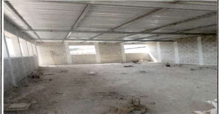
Foto 4: Instalación de piso cerámico dentro dentro de los dos salones del segundo nivel.