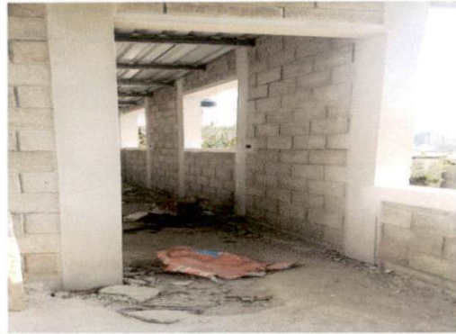
Foto 2: Instalación de 2 puertas de metal para las dos entradas de los salones.