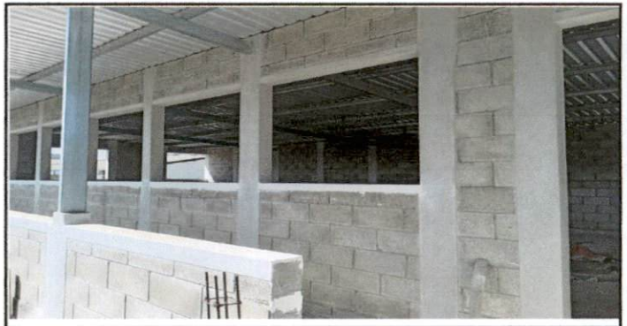
Foto 6: Colocación de Ventanas en el segundo nivel y primer nivel del establecimiento educativo.

Observación: Si es necesario se pueden agregar hojas adicionales y actualizar el número de hojas.