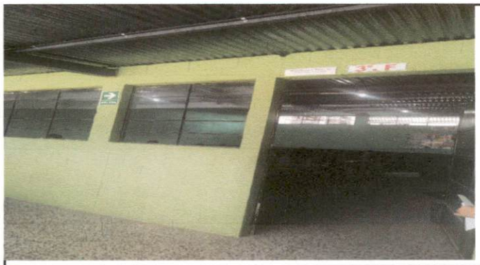
Foto 3: Esta imagen aula 2 segundo nivel. Aula levantado de techo de sexto E