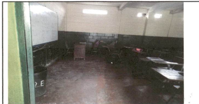
Foto 6. Esta imagen es del salon de clases, aula 2 1o. Primer nivel, instalación piso granito.

Observación: Si es necesario se pueden agregar hojas adicionales y actualizar el número de hojas.