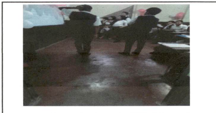
Foto No. 5, esta imagen muestra el salón de clases aula No.1, primer nivel, instalación piso granito.