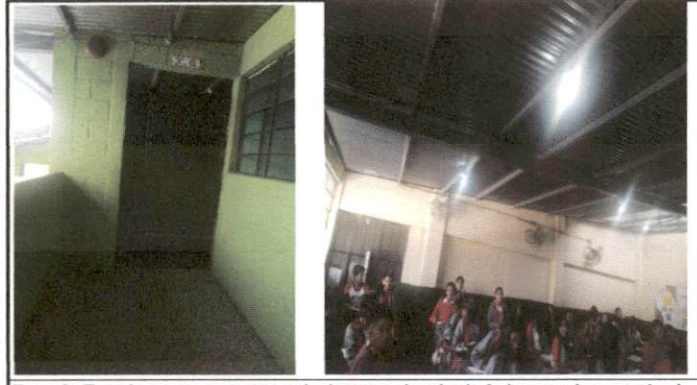
Foto 2: Esta imagen muestra aula 1 segundo nivel. Aula para levantado de techo de sexto sección F