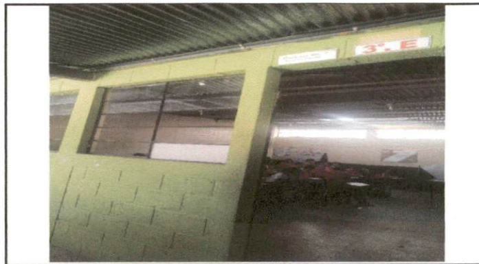
Foto 4: Esta imagen aula 3 segundo nivel. Aula levantado de techo de sexto D.