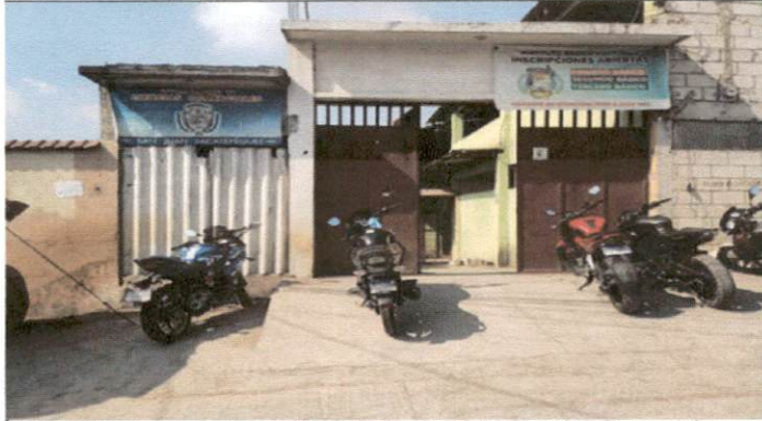
Foto 1: Frente y entrada a la Escuela Nacional de Ciencias Comerciales, Jornada Vespertina.