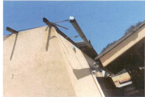
Estado actual de los salones de clases, espacio I