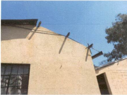
Estado actual de los salones de clases