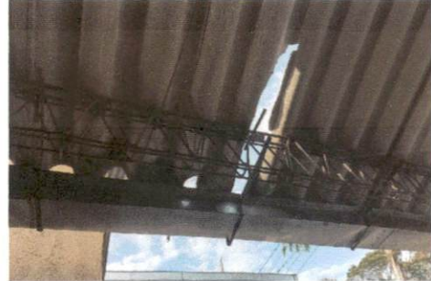
Estado Actual de los salones de clases, espacio II

Observación: Si es necesario se pueden agregar hojas adicionales y actualizar el número de hojas.