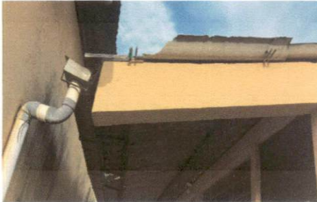
Estado Actual de los salones de clases