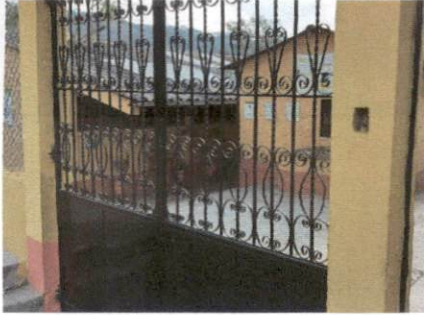
Entrada principal EORM Estancia El Rosario