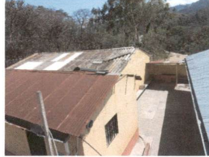
Salones de clases que deben ser reparados